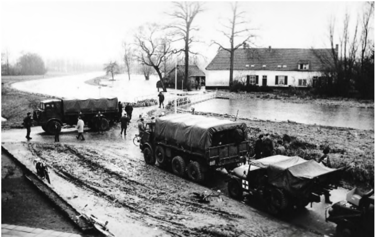
Het leger werd ingeschakeld om zandzakken te vullen om daarmee de dijken te verhogen. Op de achtergrond de voormalige rentmeesterwoning die oorspronkelijk ook behoorde tot de biotoop van de watermolen.