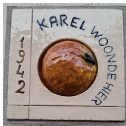
Café Vrijthof in de Molenstraat. De pentekening van de Watermolen. De tegel in de pui van café Vrijthof.