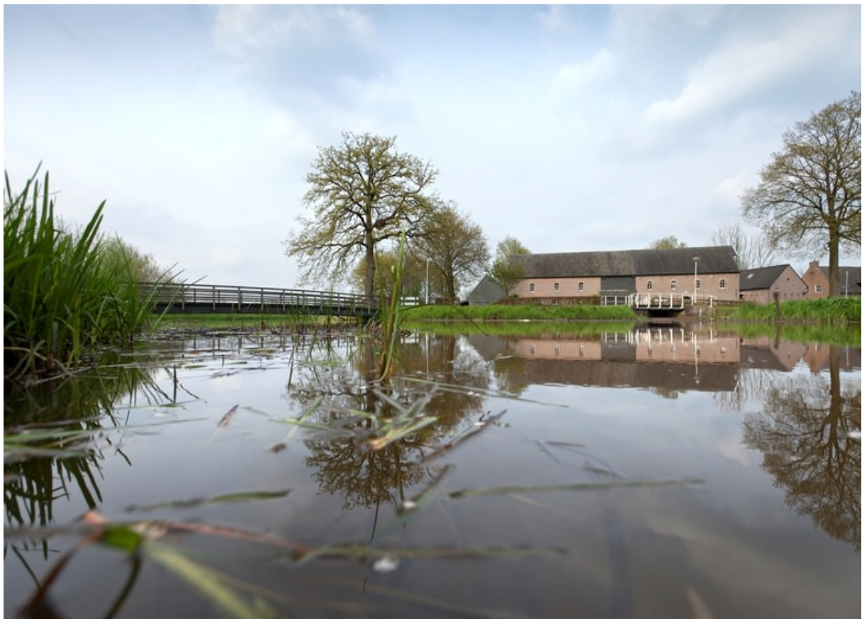
Het afwateringskanaal dat om de molen heen is gegraven i.v.m. de ruilverkaveling in de jaren zestig