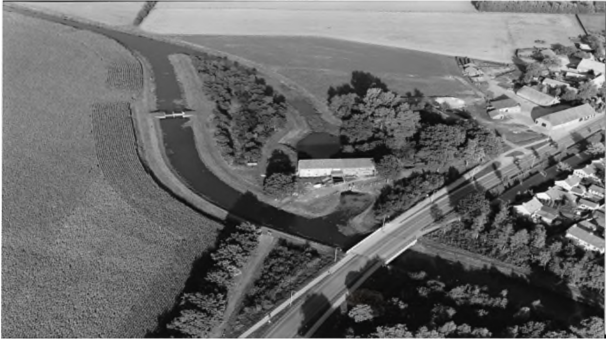
Luchtfoto van het complete complex. Met daarin duidelijk zichtbaar de stuw in het afwateringskanaal. De foto is rond 1960 genomen.