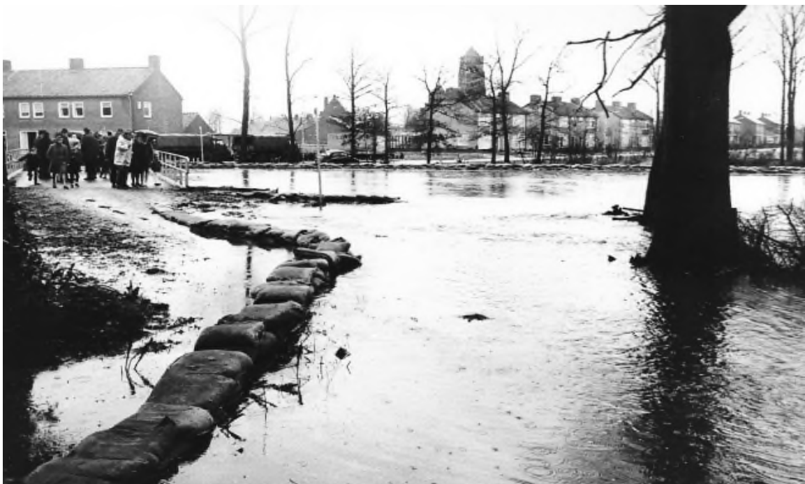
Het water staat hoger dan de bebouwde kom van Spoordonk