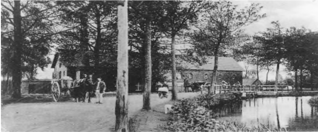
Een oude foto van rond 1900 van de Spoordonkse watermolen