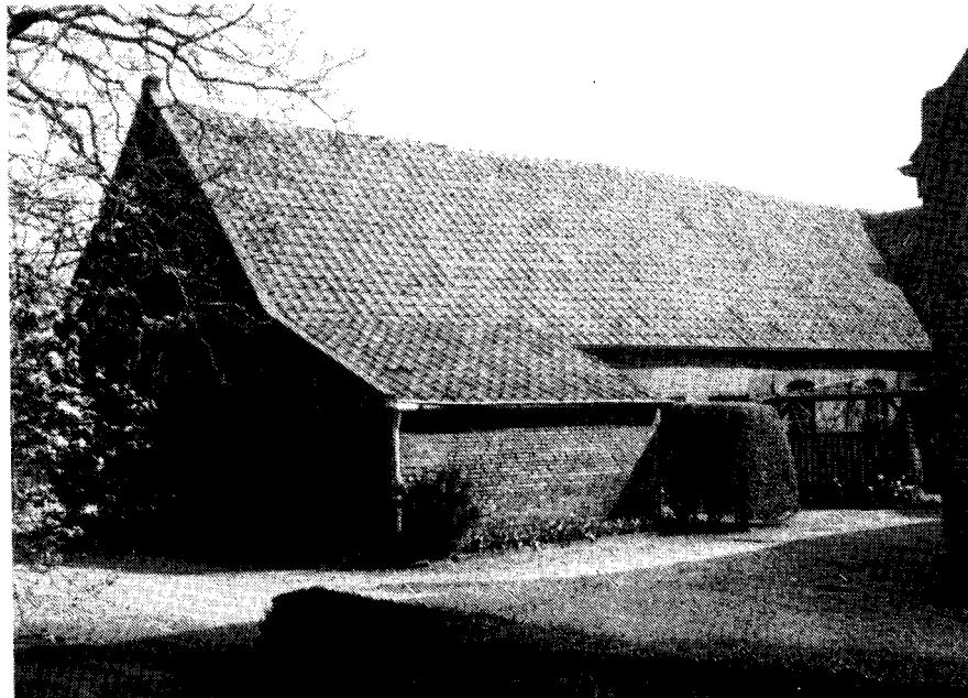
Rijkeshuisstraat 20.

1766 bij koop van Bartel en Barbara v.d. Wal "kleine huijsje en hof, grootte: 4 r. aanslag: 12 st. (verpondingsboek II, fol.110. IV, fol.93)