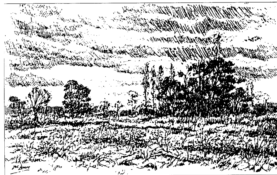
Ongecultiveerde grond van een gemeynte.

Mogelijk is toen de strook grond gelegen tegen de grens met Zeelst verkaveld en verkocht. De aldaar gelegen percelen worden op het minuutplan van het kaster uit 1832 genoemd 'de Oude Hoeven'. Hun totale oppervlakte is circa 25,5 ha (exclusief een watergat van omstreeks 3,5 ha), wat ruwweg te vergelijken is met de oude maat van 16 bunder.