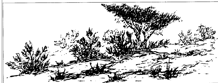
Heide met stuifduinen.

Een voor Oerle zeer bekende gemeynthe-uitgifte is die van de Grote Aard, op 1 maart 1326. Deze gemeynthe was vrij uitgestrekt. Gerechtigd waren de inwoners van de gehuchten Zandoerle, Knegsel, de Hees onder Eersel, Hoogcasteren onder Hoogeloon, Vessem en Wintelre.