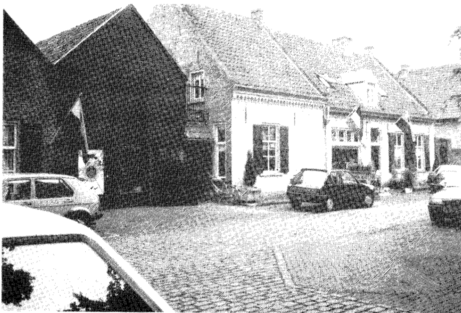
Bloemboefiek Elha, Torenstraat 4

De kadastrale leggers van de gemeente Oirschot geven de volgende eigenaren.