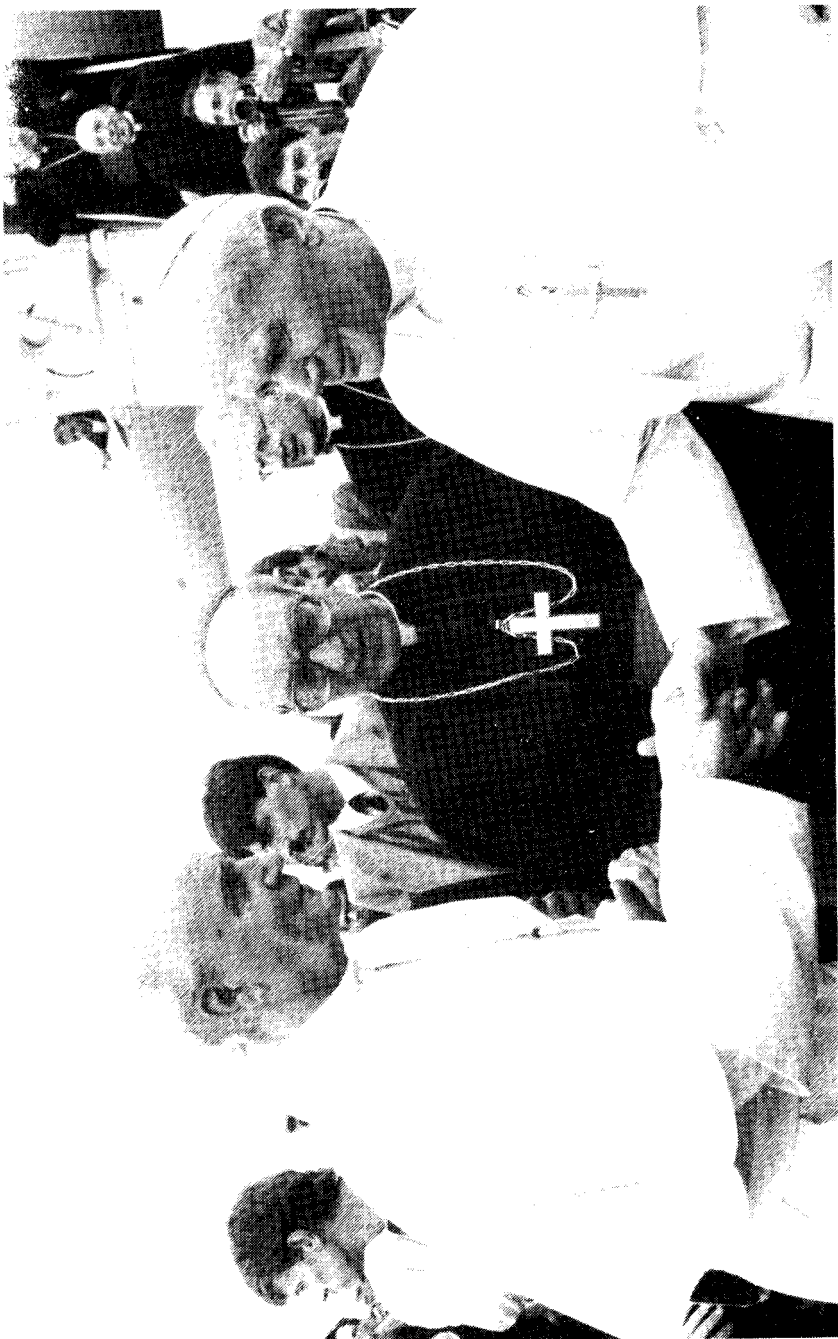
Foto: L'Osservatore Romano. Met welwillende toestemming van de auteur overgenomen uit: J.F.C.M. Biinen, Jubeljaar 1987 Sint-Jan-de-Doperkerk Oerle