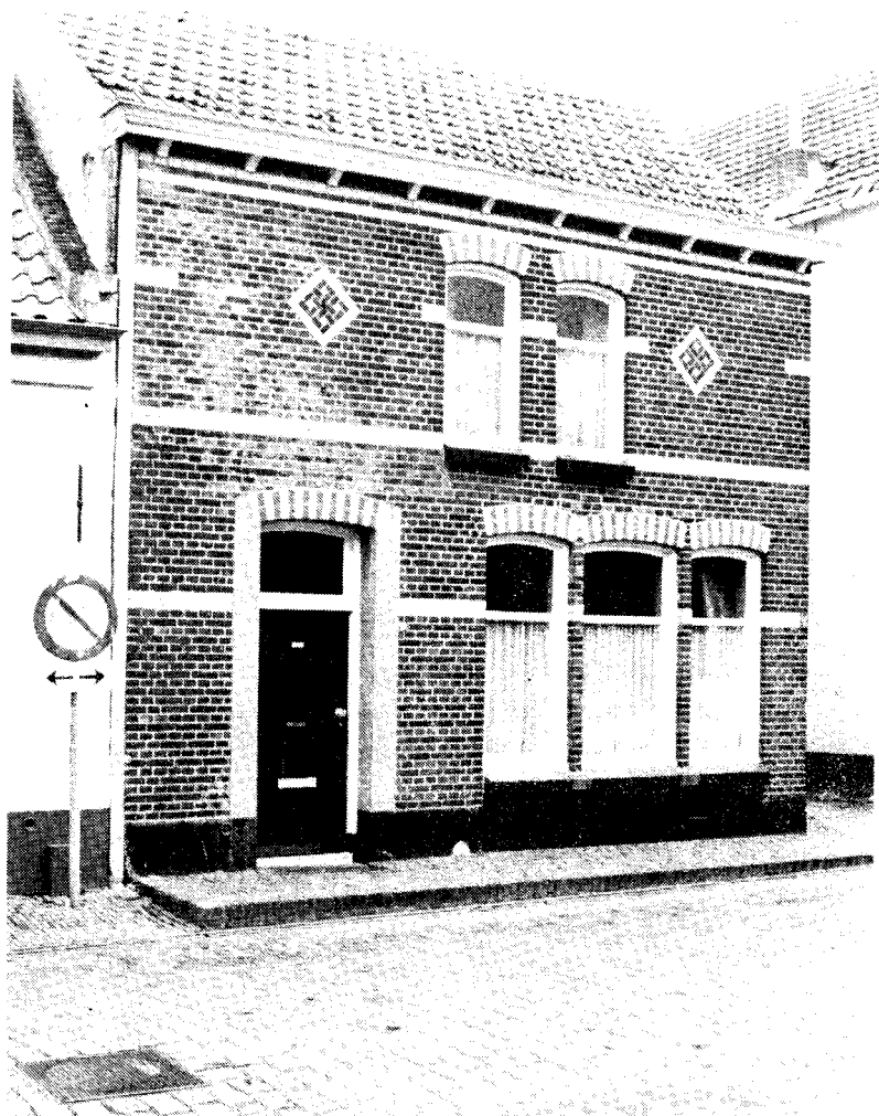
Huis "De Wereld", Molenstraat 8.