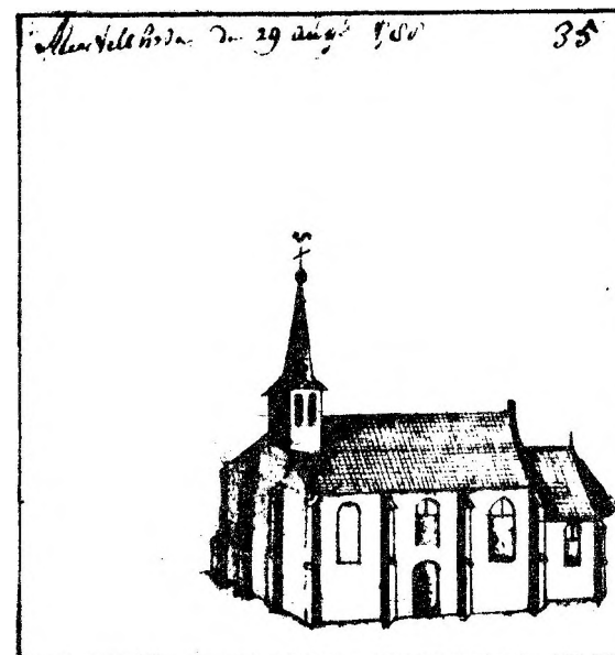
Afb. 4 De oude Lambertuskerk in 1788 Getekend door Hendrik Verhees (uit ref. 13)

Accordeert met het voorschreven register w.g. P.J.G. Vogelvanger.