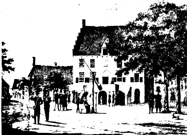
liet uit de vijftiende eeuw daterende „Regthuis” van Oirschot, thans raadhuis, war een schets uit het jaar 1798

In de gevel boven de hoofdingang was een zonnewijzer, de enige tijd-aanwijzing van de plaats. Daarboven was een kleine luidklok. Zo bleef het gebouw tot de achttiende eeuw, toen men ten gevolge van de Franse neigingen het nodig oordeelde het gebouw te moderniseren. De vensters in de voorgevel werden vervangen door houten kozijnen met schuiframen met kleine ruiten. Binnen werd een houten trap aangebracht en werden de zolderingen van gepleisterde plafonds voorzien. Er werden binnen muren en wanden gemaakt voor indeling. In het gedeelte ter rechterzijde werden de schuiframen aan de binnenzijde van ijzeren traliën voorzien. Dat zal de lokaliteit geweest zijn waar de bewoners der cellen te woord gestaan werden.